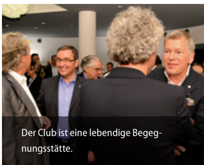
Der Club ist eine lebendige Begegnungsstätte.