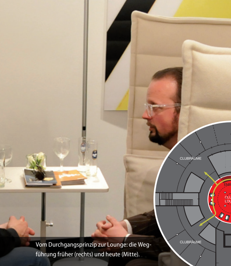
Vom Durchgangsprinzip zur Lounge: die Wegführung früher (rechts) und heute (Mitte).