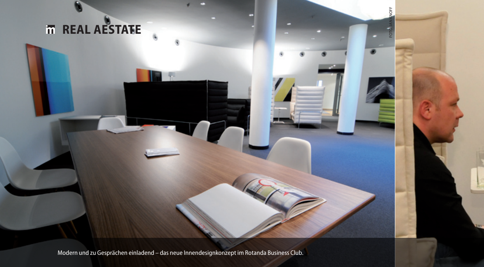
Modern und zu Gesprächen einladend – das neue Innendesignkonzept im Rotonda Business Club.